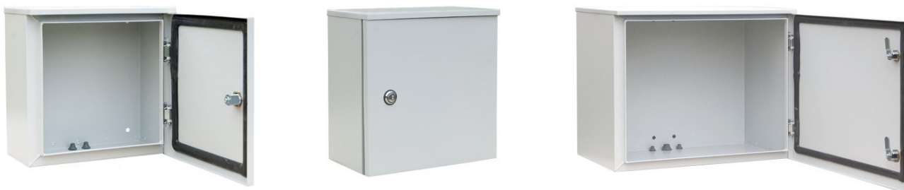
SM- 30/30/15, SM- 40/33/23, SM- 42/55/32